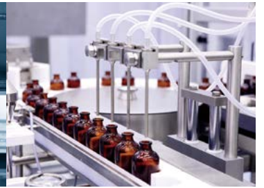
医療バイオテクノロジー

ねじ締め、塗布、積みおろし、搬送、組立て、溶接、梱包、検査、切断など、 自動化機器全般に広く応用可能です。